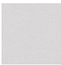
Aluminium (1) (ral 9006)