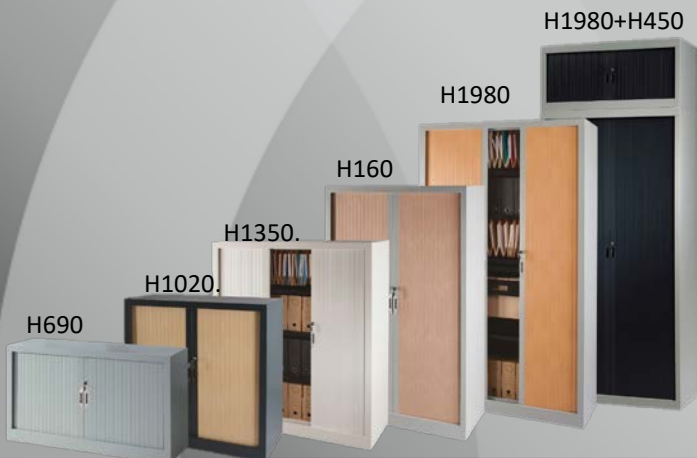
Armoires prof. 430 mm

monoblocs alliant esthétique, fonctionnalité, robustesse, ergonomie pour vous apporter des solutions variées et répondre ainsi à vos exigences.