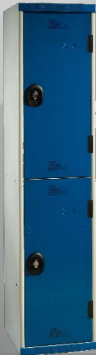
Visuel non contractuel