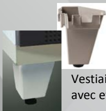
Vestiaires disponibles avec et sans pied

Le procédé de profilage agrafage Seamline® renforce la résistance des montants, équivalent à une tôle ép. 10/10 ème pliée.