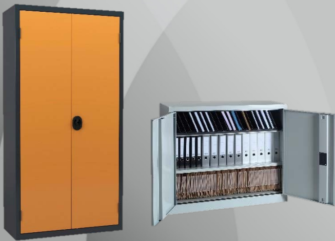
Armoires prof. 430 mm

Une gamme complète d'armoires monoblocs alliant esthétique, fonctionnalité, robustesse, ergonomie pour vous apporter des solutions variées et répondre ainsi à vos exigences.