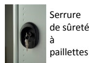
Serrure de sûreté à paillettes