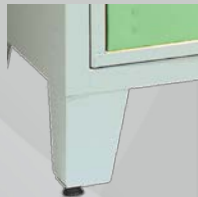
Pieds soudés en tôle électrozinguée