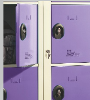
Ouverture centralisée de la porte maîtresse